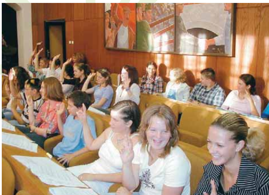
Svi smo »za«!

Debata kao umijeće i vještina uči kulturu dijaloga u javnoj komunikaciji oslanjajući se na snagu argumenata, a ne na argument snage, što svakako predstavlja poželjan demokratski standard. Ona pospješuje i razvija i kulturu slušanja, uvažavanja »protivničkog« govornika i nenasilnog suprotstavljanja drukčijem mišljenju, pa pridonosi i demokratskom ponašanju.